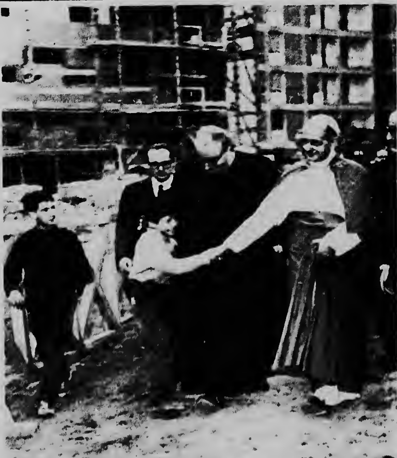
ROMA--Un mucha homber ta rek pa duna papa Paulo vi man, mientras e ta bishita un cas cu gobierno di Roma a traha pa hendenan pover.

LODI, CALIFORNIA--UPI--Don Elston, expitcher relevista di Cachorros di Chicago a ser designa manager di e equipo sucursal di Cachorros den Liga di California.